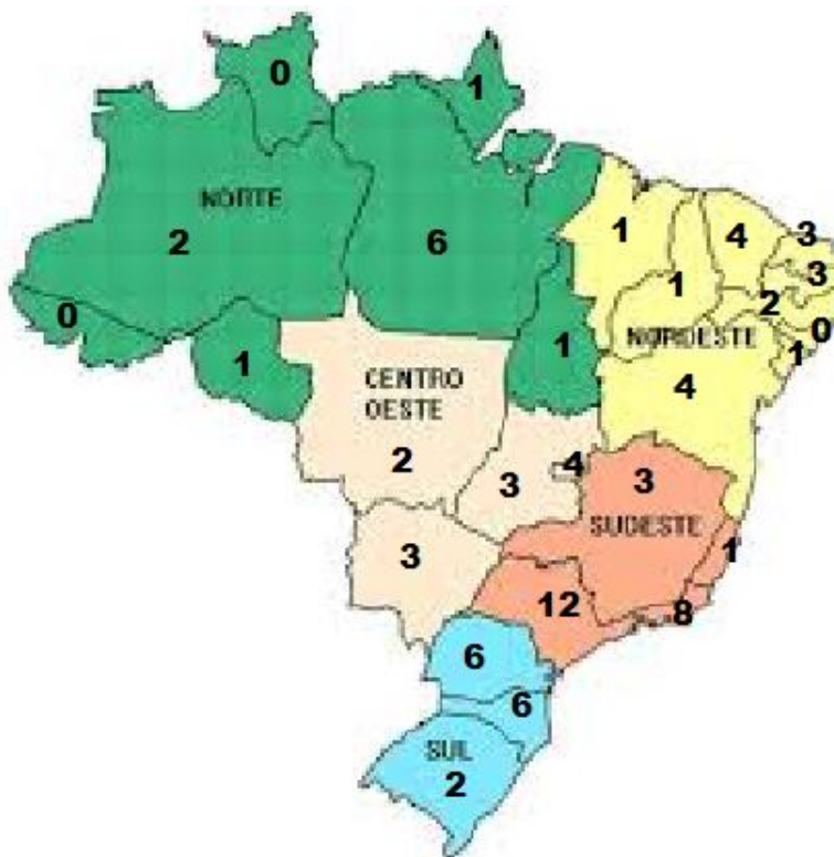
Figura 1: Distribuição de Programas por Região em 2012

A distribuição dos Programas nas Unidades Federativas pode ser visualizada na Figura 1, onde verifica-se que apenas 3 Estados ainda não possuem cursos da Área: Acre, Roraima e Alagoas.